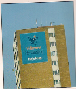
Vollsmose - lige nu...

Det er mudret og pløret. Vi laver sådan nogen trampveje som vi selv tramper. Og de er så møgbeskidte, evig og altid ungerne. det er jo sjovt det her altså. Så ja, det er et pløre og et ælte lige det første stykke tid. Ja her bagved. Der holder kranerne og sætter vægge ind og det går jo hurtigt ik' å', én to tre så har de sat en lejlighed op. Når vi har været væk, været på arbejde, når vi så kommer hjem så ...hold da op, prøv lige at se! Nu er der kommet et hus mere! Lige på sådan en eftermiddag ik' o? Man tror en betonblok er en betonblok. Men det er jo spændende at holde øje med. Vi har solgt bilen og købt hver en cykel. Det er det mest praktiske. Begge ungerne har fået en fin ny cykel. Det syntes vi er smart, så kan de også cykle til skole. Det er ikke fordi vi ikke har råd til bil. Det er den nye stil. Det er lidt sundt, lidt smart ik' å'.