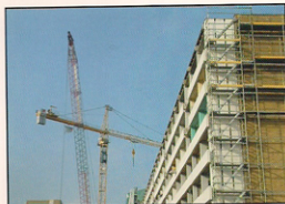
Vollsmose - lige nu...