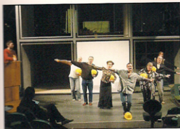
Foto fra prøverne

Jeg er meget praktiserende muslim derhjemme. Jeg går ikke så meget i Moskén. Jeg har gået med tørklæde siden jeg var 18. Det var ca. da Pia Kjærsgård dukkede op. Der omkring begyndte jeg at gå med tørklæde.